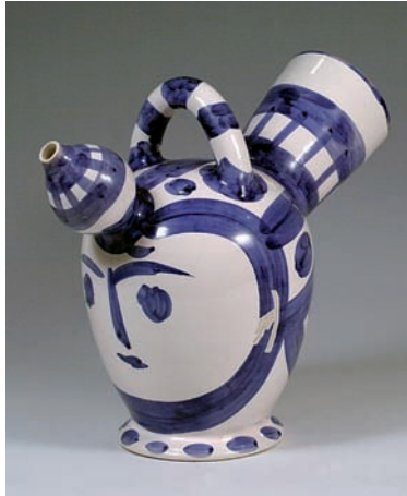
▲ Càntir "cap femení" 1952 32,5 x 38 cm Dipòsit Sra. Ma. Lluïsa Salvà N.I. 1.824