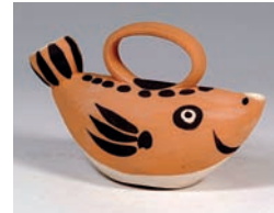
▲ Càntir "peix" 1952 12 x 19 cm Dipòsit Sr. Ramon de Santiago N.I. 2.870