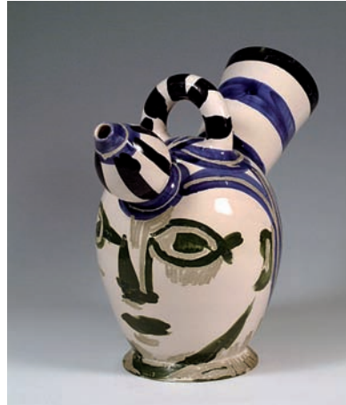
▲ Càntir "cap masculí" 1952 32,5 x 38 cm Donació família Esteve-Ventós N.I. 2.854