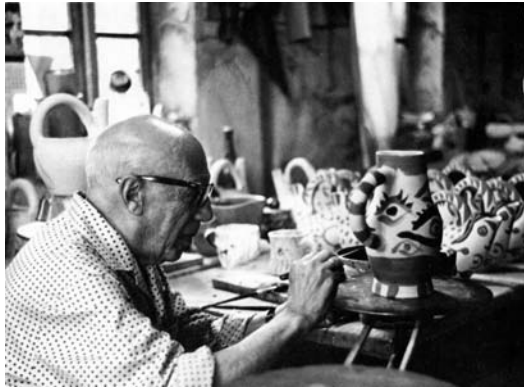
▲ Picasso decorant una de les seves ceràmiques, amb càntrils al fons Any 1966